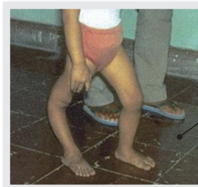
ポリオの後遺症により足に“まひ”が残った幼児